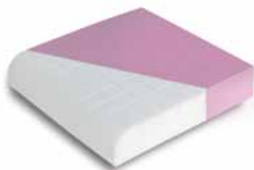
Pakiet całodobowej opieki — opcjonalna poduszka do siedzenia.