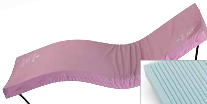
Materac kładziony na materac bazowy — jest również dostępny i łatwy w montażu