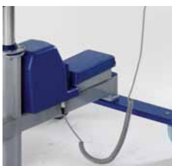
Model elektryczny, zasilany akumulatorowo