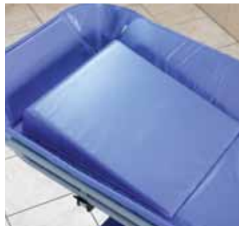
Poduszka w kształcie klina

Uchwyt do kroplówek jest najpopularniejszy w środowiskach opieki krótkoterminowej.