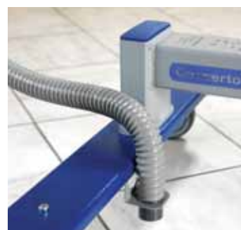
Uchwyt do przewodu odpływowego