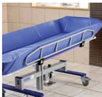
Wyższe barierki boczne