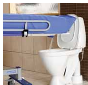
Wygodny odpływ – do toalety lub podłogowy