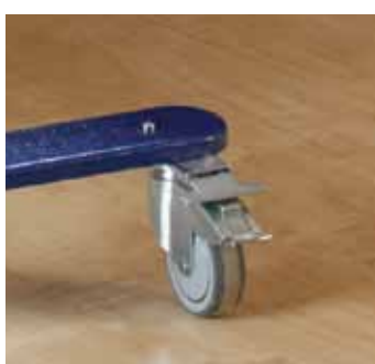
Mechanizm do jazdy na wprost