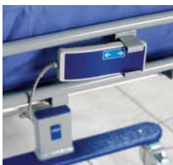
Uchwyt na pilota, tylko w modelu elektrycznym