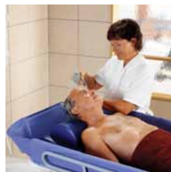
Concerto to idealna platforma dla procedur takich jak mycie głowy.

Concerto jest częścią obszernej oferty produktów firmy ArjoHuntleigh przeznaczonych do kąpeli pod prysznicem. Wózek prysznicowy Concerto , fotel Carendo i krzesło Carino to produkty dzięki którym ośrodki opieki otrzymują optymalne rozwiązania w zakresie kąpeli pod prysznicem pacjentów na wszystkich poziomach sprawności.