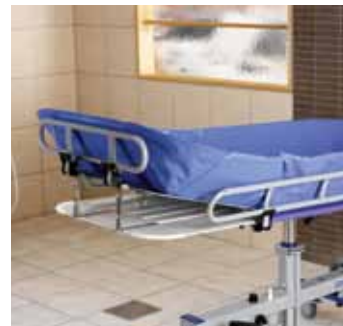
Regulowane podparcie pleców (trzy pozycje)