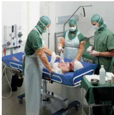
Miękki materac sprawia, że pacjenci czują się komfortowo podczas przedoperacyjnych procedur higienicznych.

Podczas opieki krótkoterminowej mobilne urządzenie jest szczególnie przydatne. Wózek prysznicowy Concerto może być szybko przemieszczany tam, gdzie jest niezbędny w danej chwili. Nasz wózek prysznicowy, który może także służyć jako użyteczny stół pielęgnacyjny dostępny jest w trzech różnych długościach, dopasowując się do dorosłych lub dzieci wymagających opieki krótkoterminowej.